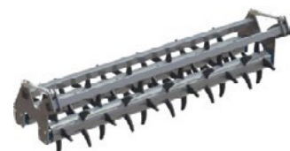
Rouleau double Ø 520 mm