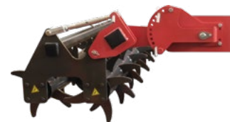
Rouleau double Ø 520 mm avec régulation mécanique