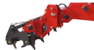
Rouleau double Ø 520 mm avec régulation hydraulique