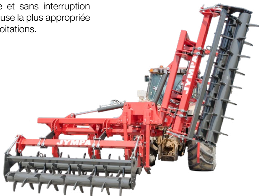
Modèle POLARIS-9R-PC avec rouleau double Ø 520 mm avec régulation mécanique