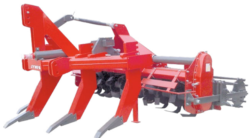
Modèle DUPLA-2500-S avec rouleau barres simple Ø 410 mm

“Exploitation maximale de la puissance du tracteur”