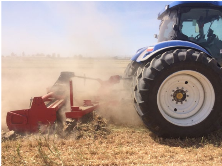
Modèle DUPLA-3000-R avec rouleau barres simple Ø 410 mm