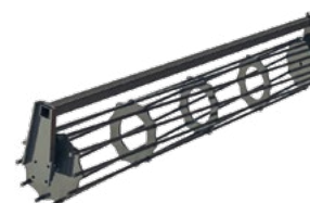
Rouleau barres simple