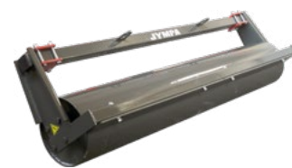
Rouleau lisse Ø 325 mm