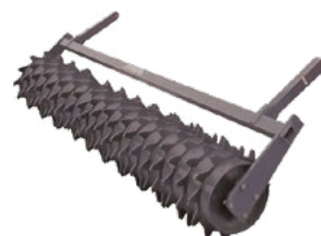
Rouleau packer Ø 430 mm