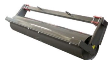
Rodillo liso Ø 325 mm