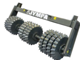
Rodillo estrella Ø 500 mm