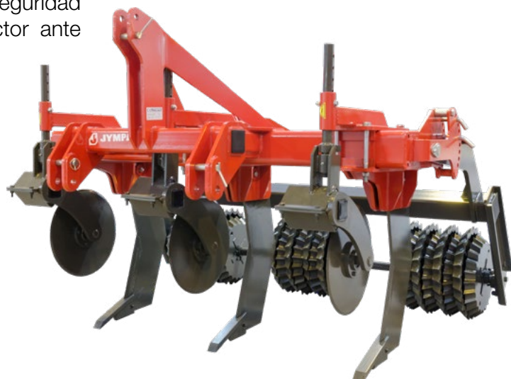
Modelo ALASIA-3-AR con rodillo estrella \varnothing 500 mm