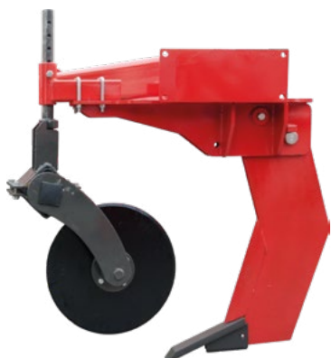
Discos de corte para Subsolador ALASIA