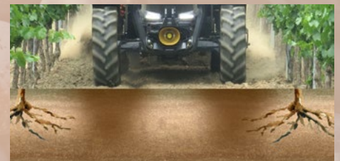
Compactación del terreno entre las calles de los viñedos, por el paso sucesivo de tractores.