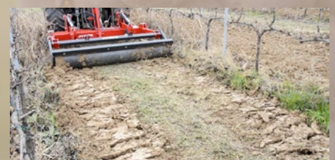
Sin alteración de la superficie.